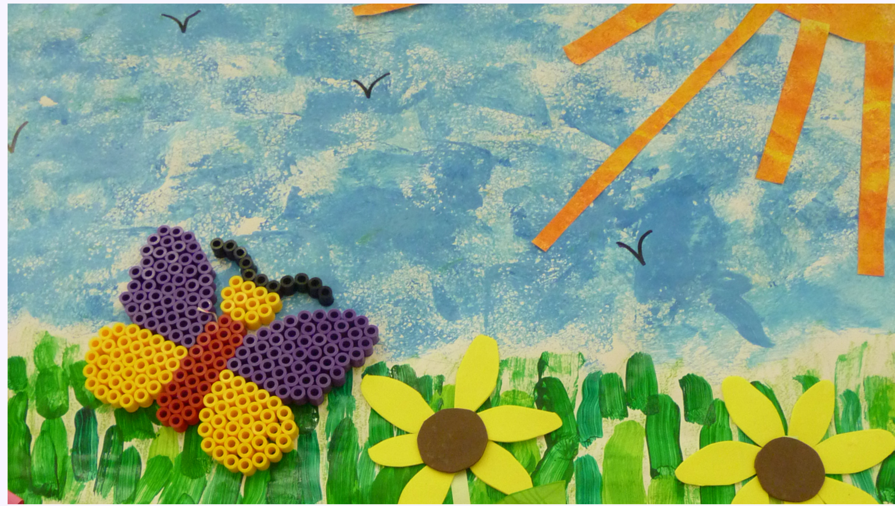
FRESQUE RÉALISÉE PAR LES ENFANTS (DETAIL)