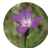
Nielle des blés