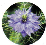
Nigelle de Damas