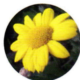
Chrysanthème des moissons