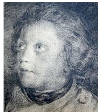
François Huber enfant dessiné par son père 10

Huber était membre de la Société de physique et d'histoire naturelle de Genève (depuis 1790 21 ) et membre correspondant de l'Académie des sciences de France (depuis 1813 22 ).